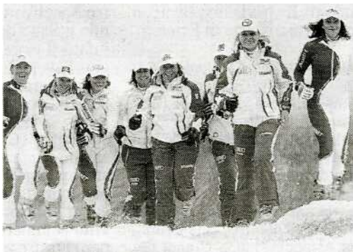
La squadra nazionale femminile delle specialità tecniche al foto shooting al passo dello Stelvio